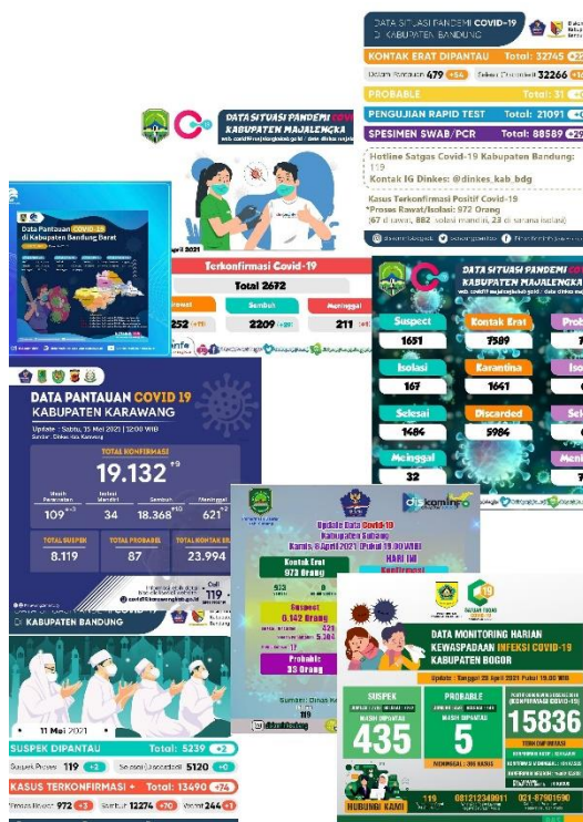
Gambar 2 Template laporan penyebaran Covid-19 di berbagai wilayah Jawa Barat yang terunggah di instagram

Bentuk-bentuk pelaporan setiap daerahnya berbeda-beda namun melalui aplikasi yang sama untuk mengakumulasi data. Setiap data yang tim relawan peroleh kemudian dilakukanlah publikasi. Publikasi berupa informasi data didesain menggunakan gambar yang diunggah melalui media sosial setiap daerah masing-masing.